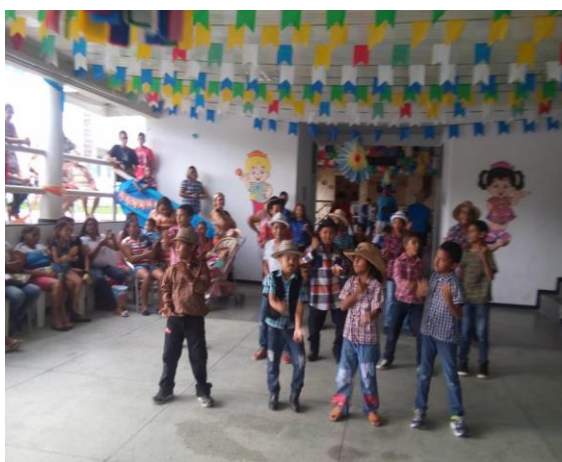
Apresentação de dança das crianças