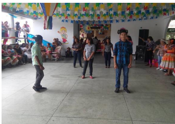
Apresentação do grupo de teatro dos adolescentes