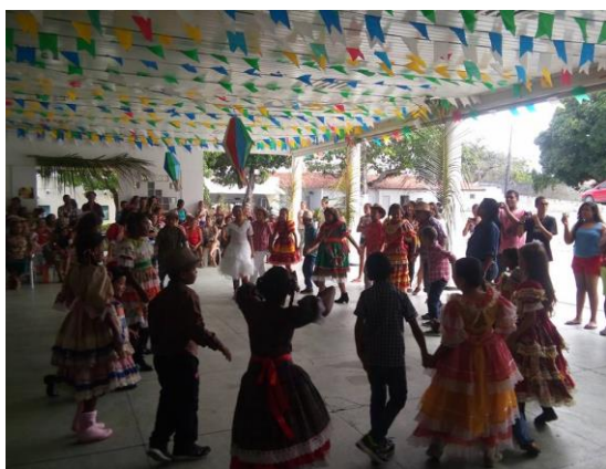
Quadrilha do reforço escolar