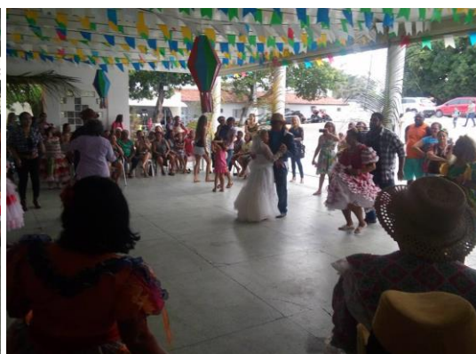
Quadrilha dos idosos