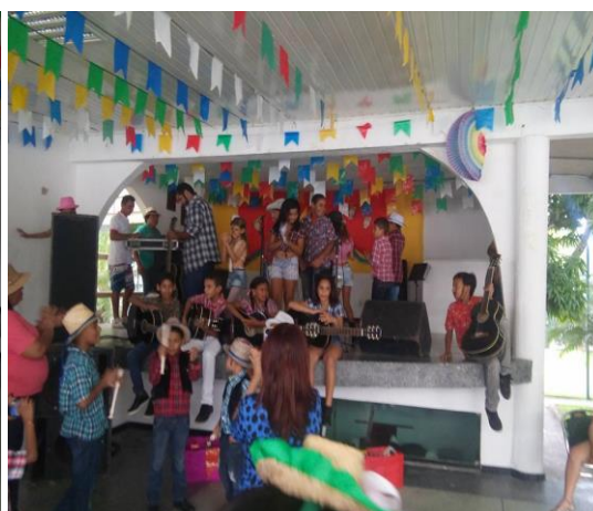
Apresentação musical do reforço